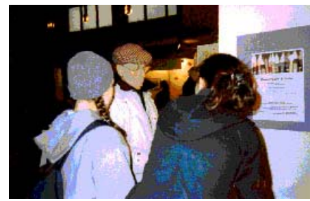
Begegnung mit Künstlern