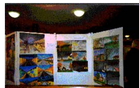
Ausstellung im Kunstraum Kirche