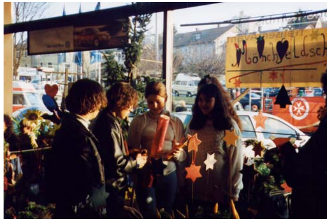
Bazare aller Art

Die Schülerinnen und Schüler bearbeiteten und verwalteten alles ganz selbständig: Die Finanzen, die Kontakte, die Öffentlichkeitsarbeit, die Bürokratie ..... natürlich haben sie auch Nutzen vom Gewinn: Der fließt nämlich in die Schullandheimkasse.