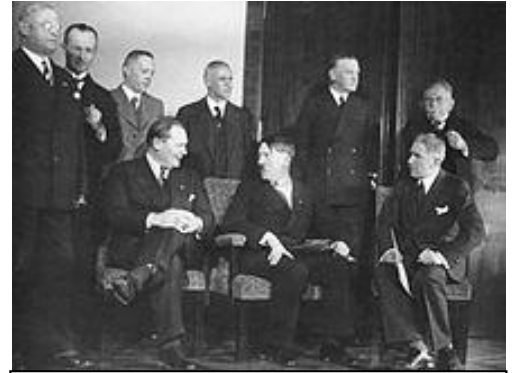
Kabinett Hitler(30. Januar 1933)