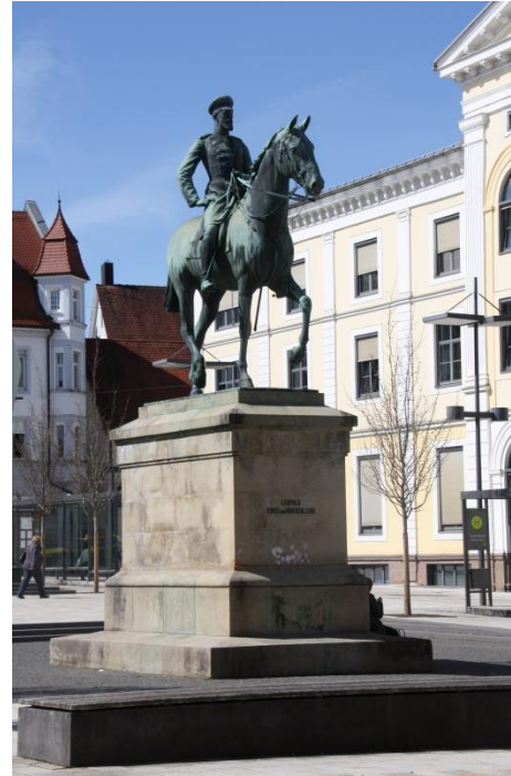
Sigmaringen: Fürst Leopold (1835-1905)