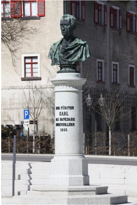
Sigmaringen: Fürst Karl (1785-1853)