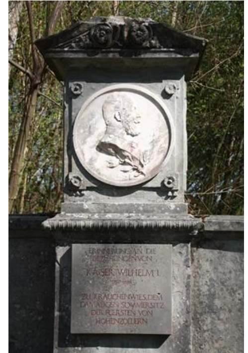
Krauchenwies: Kaiser Wilhelm I. (1797-1888)