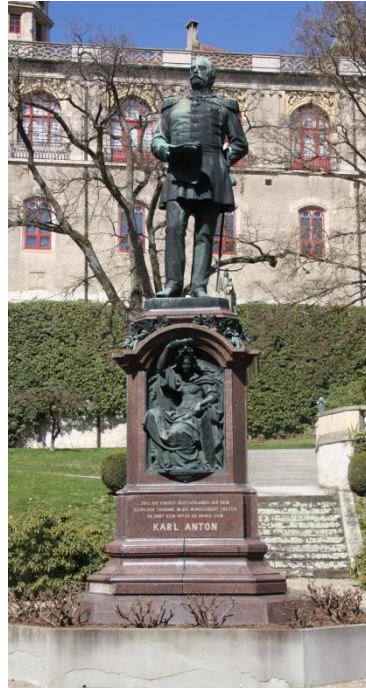
Sigmaringen: Fürst Karl Anton (1811-1885)