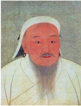
Dschinghis Khan, Bildnis aus dem 14. Jh.