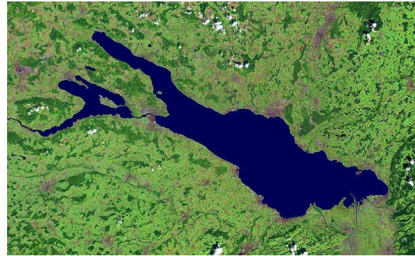
Satellitenbild der Bodenseeregion