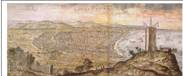
Ansicht Barcelona 1563 von Anton van den Wyngaerde

Im Textilrevier zwischen Augsburg und Bodensee wurde viel Flachs angebaut. Daraus stellte man Leinwand her, ein Produkt, das auch im Mittelmeerraum sehr begehrt war, da dort kein Flachs wuchs. Unterschiedliche Kaufleute aus Oberschwaben zogen daher nach Barcelona, um im kleineren Stil Handel zu treiben. [...]