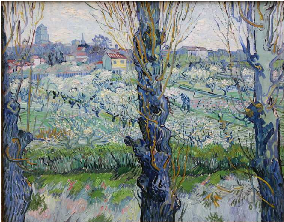
Vincent Willem van Gogh (1853-1890)