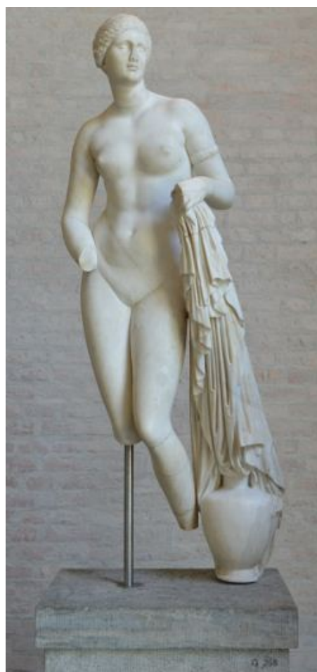
Bild: Venus von Knidos, Glyptothek München.

Kennzeichen: Delphine, Taubenpaare, und als Symbol Spiegel und die Muschel.