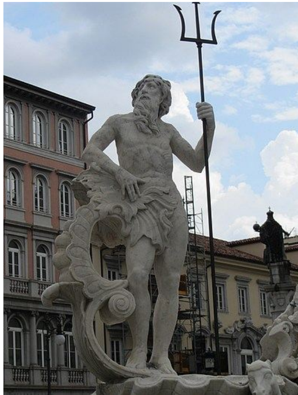
Neptun, der Gott des Meeres. Neptunbrunnen in der norditalienischen Stadt Triest (Piazza della Borsa).

Sein Kennzeichen ist der Dreizack, den man auch auf dem Foto einer Brunnenfigur erkennt.