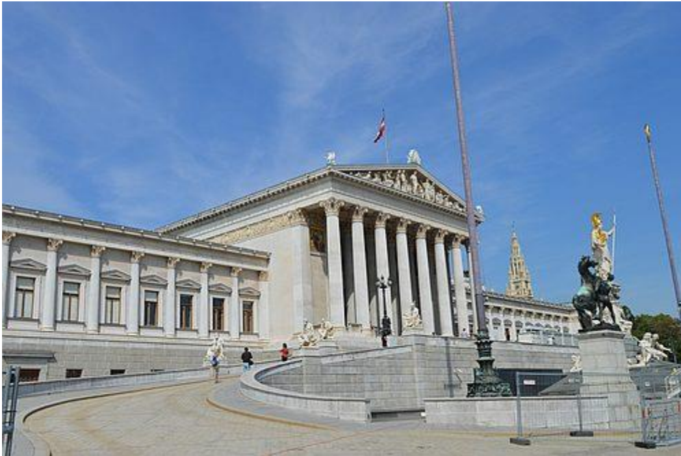
Das Parlamentsgebäude in Wien