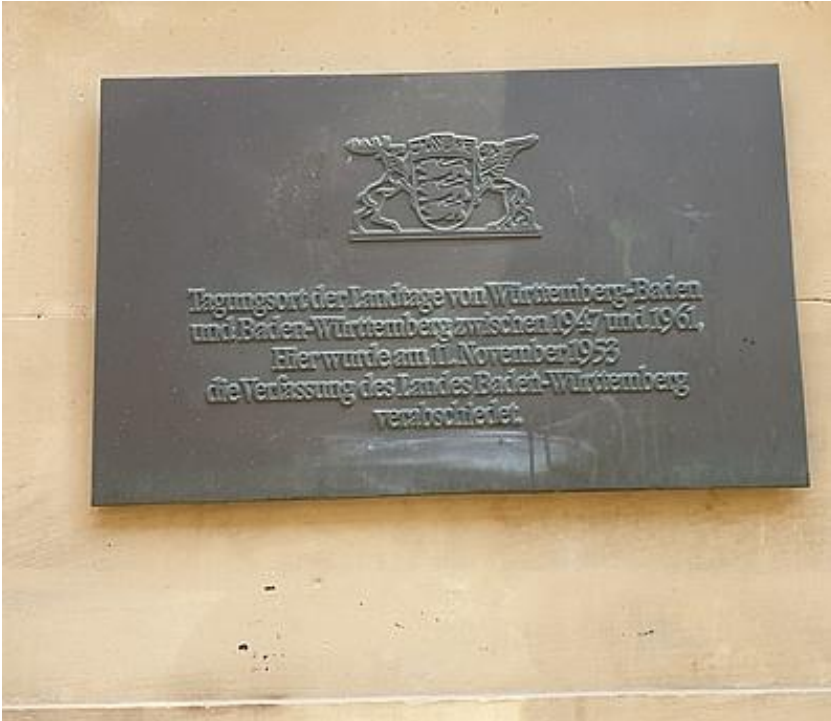
Die Plakette am Alten Landtag

Informationen zum Alten Landtag im Internet: