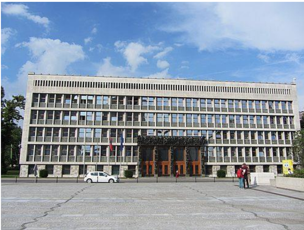
Das Parlamentsgebäude in Ljubljana