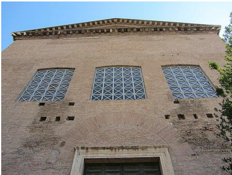
Die Fassade der Curia.

Die Curia als Sitz des römischen Senats in der Antike: ein Vorläufer eines Parlaments