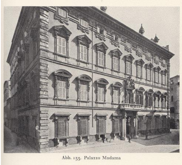
Abb. 133. Palazzo Madama

Italiens Parlament besteht aus zwei Kammern, aus dem Senat und der Abgeordnetenversammlung (Weiteres bei der Wikipedia .)