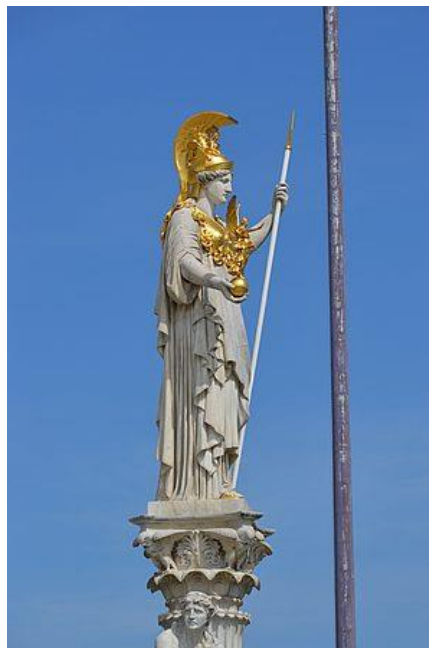
Statue der Athena vor dem Parlamentsgebäude in Wien

Über das Parlament der Republik Österreich in Wien und sein Gebäude informiert ein Artikel auf Wien-GeschichteWiki .