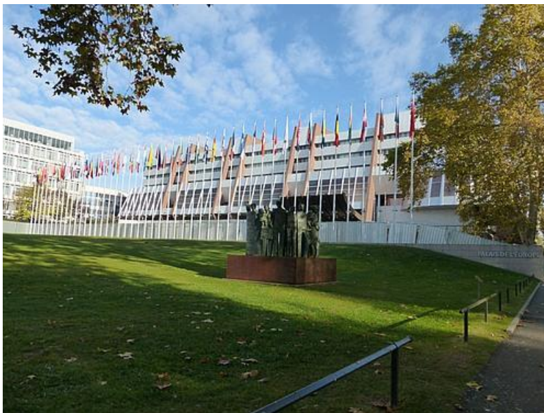
Gesamtansicht des Conseil d'Europe/ Europarat