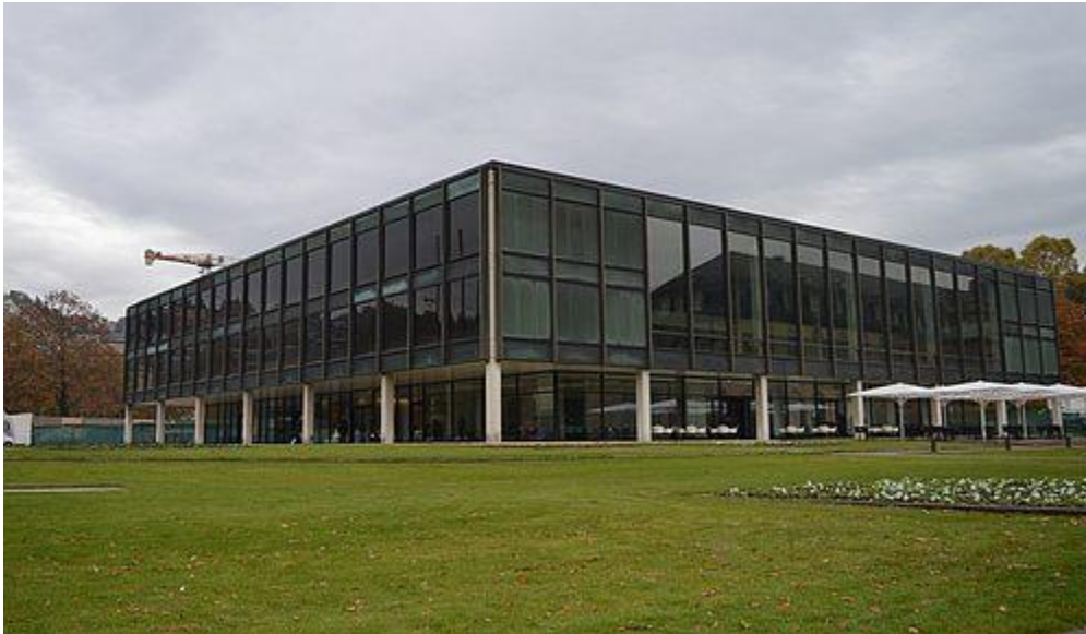
Das Haus des Landtags in Stuttgart

Informationen zum Gebäude und seiner Geschichte: