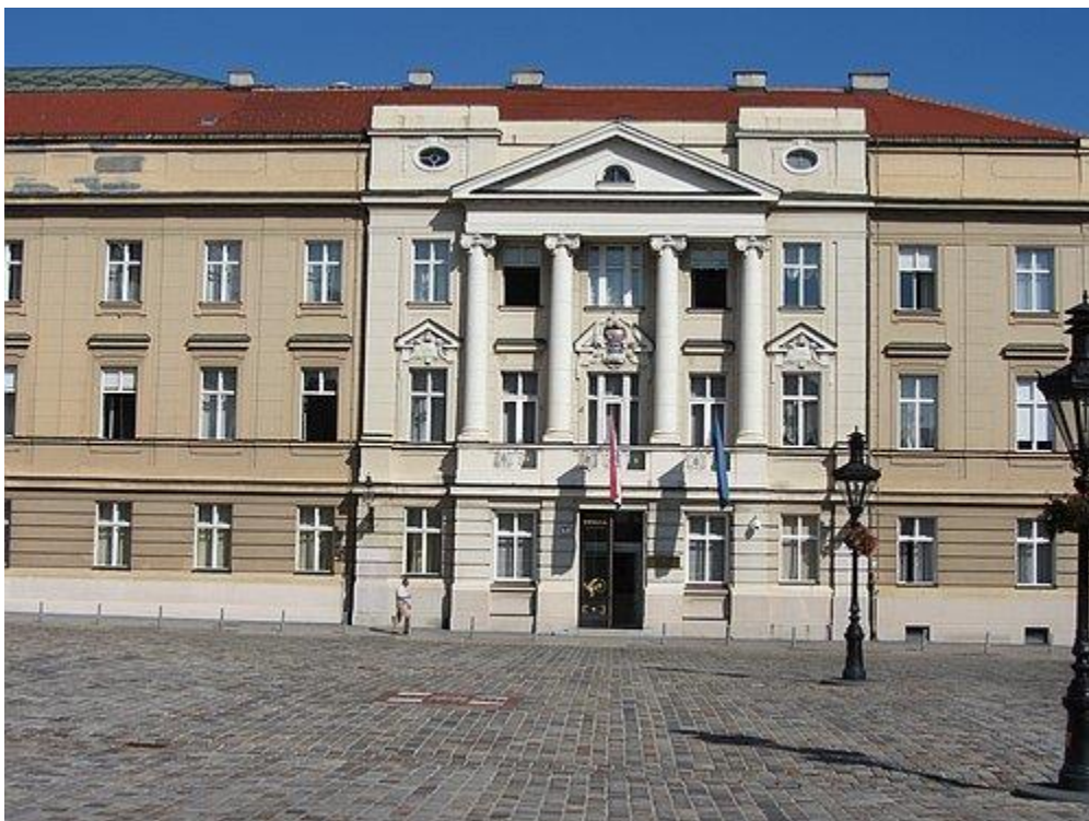
Das Parlamentsgebäude in Zagreb