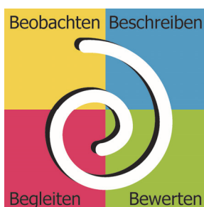
Abb. 1: Die 4B Förderspirale

Formative Rückmeldungen sind kontinuierlich und begleiten den Lernprozess.