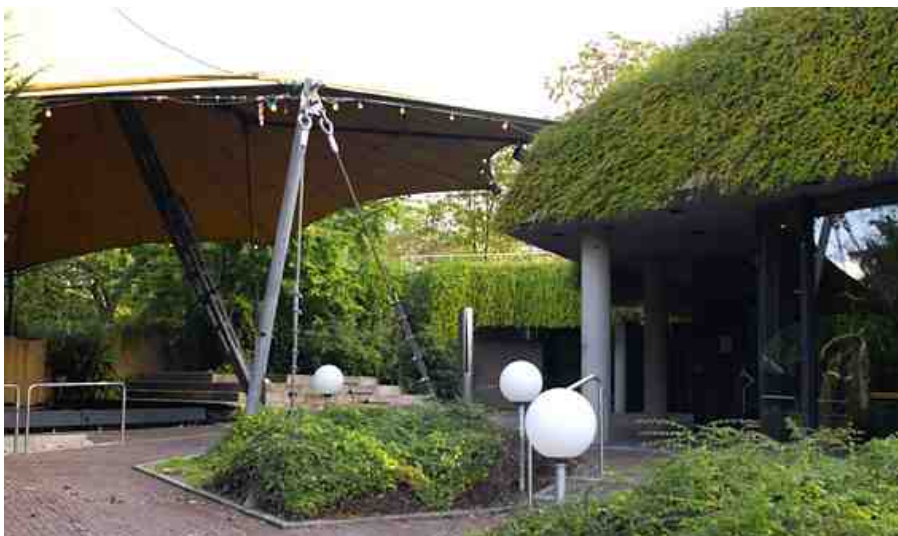
Landespavillon, Gesamtansicht Adresse: „Willy-Brandt-Straße 25“.