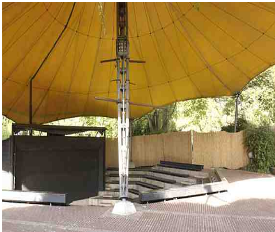
Außenansicht Amphitheater mit Zelt Dach