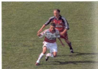
Starten – Stoppen – Hakenslagen