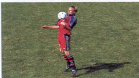
An- und Mitnahme mit Brust – Kopf ...