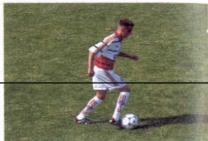
Balltreiben und Ballführen mit Außenseite – Innenseite – Spann – Sohle