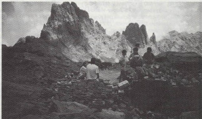
Korsika: Im Gebirge