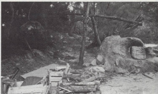
Korsika: selbstgebauter Backofen