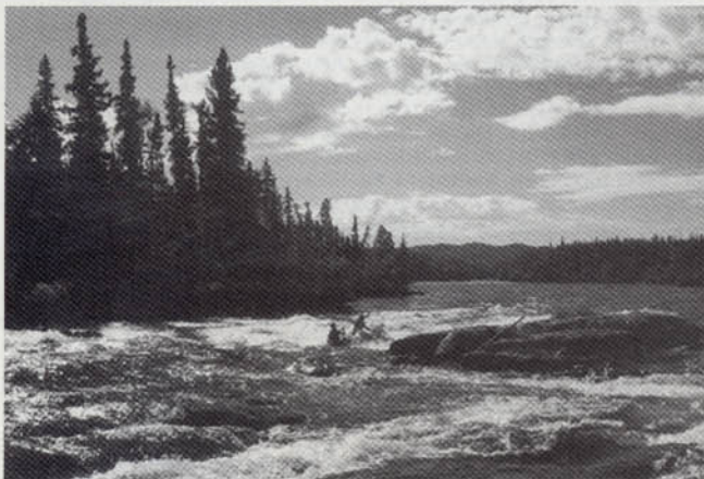
Kanada: Angstlust in Stromschnellen