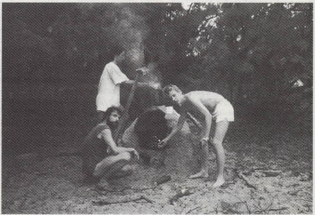
Korsika: Brotbacken in unserem selbstgebauten Backofen