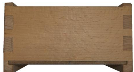
Fotografie des Hinterstücks