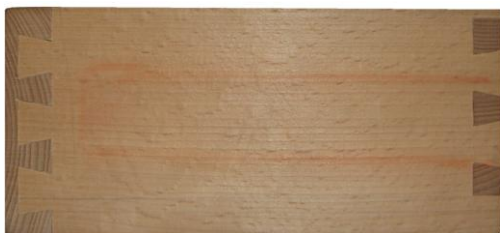
Fotografie der Seite

Konstruktion: Vorderstück/Seite halbverdeckt gezinkt Hinterstück/Seite offen gezinkt Hinterstück 8 mm abgesetzt und abgerundet Boden eingenetet Seiten innen gefast 45° alle Kanten 2x2 mm gefast