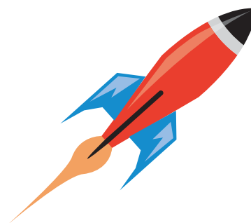
Abbildung: Symbolbibliothek Adobe Illustrator