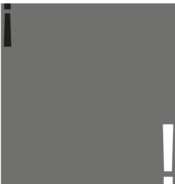
Abb. 3: Vorschlag_03_BP_IK