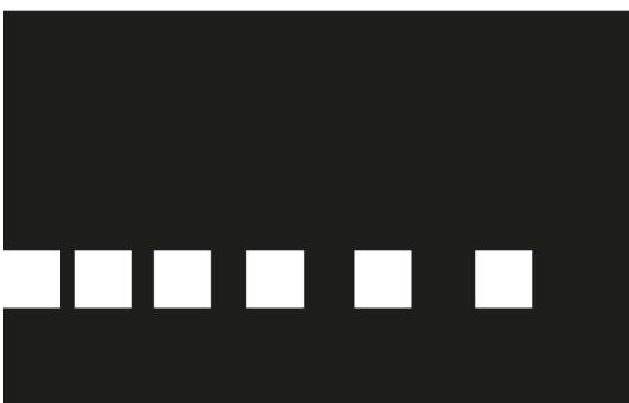
Abb. 4: Vorschlag_04_IK