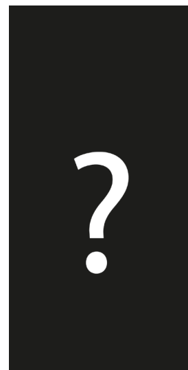
Abb. 2: Vorschlag_02_IK