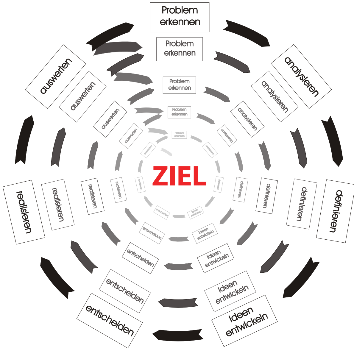
Grafik GL, TS