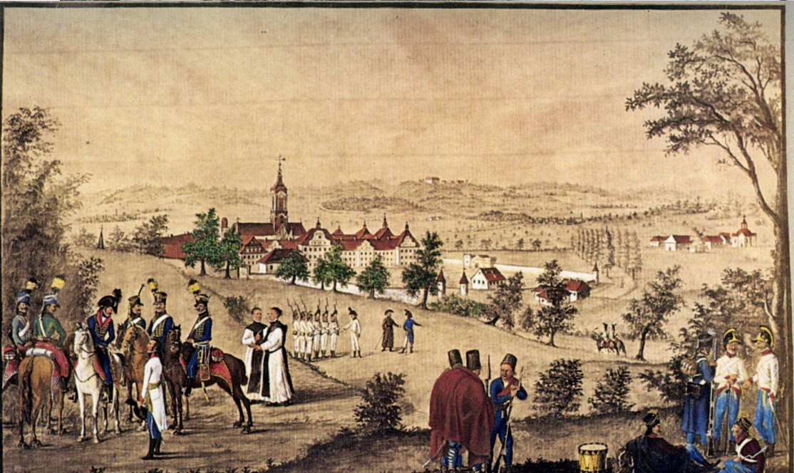
Bilder im Uhrzeigersinn (angefangen oben links): Salem 1536 ( https://commons.wikimedia.org/wiki/File:Hirschvogel_Salem_1536.jpg#/media/File:Hirschvogel_Salem_1536.jpg ) , Salem 1681 ( https://commons.wikimedia.org/wiki/File:Salem_1681.jpg#/media/File:Salem_1681.jpg ), Salem 1804 ( https://commons.wikimedia.org/wiki/File:Salem_1804.jpg#/media/File:Salem_1804.jpg ), und Salem 1708 (Kupferstich (Ausschnitt) v. J. Fridrich nach Chr. Lienhardt, 1708 ( http://www.kloester-bw.de/leobild.php?typ=4e6z584tr&nr=652&bild=201 ))