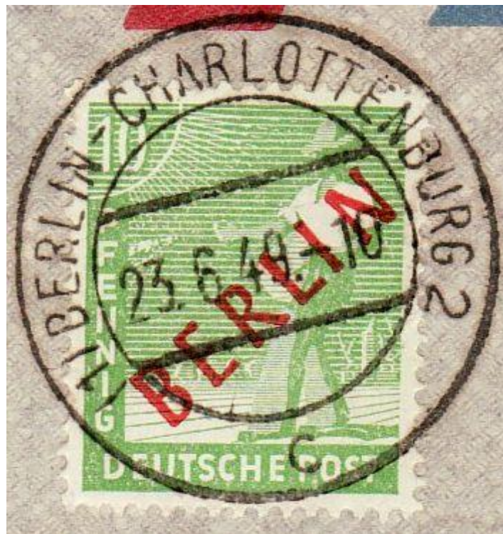
Versandort und Datum