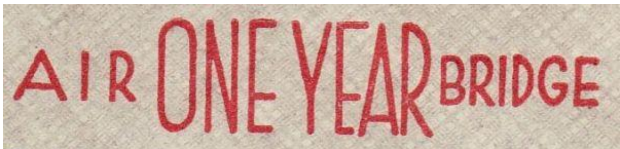
Einjähriges Jubiläum der Luftbrücke