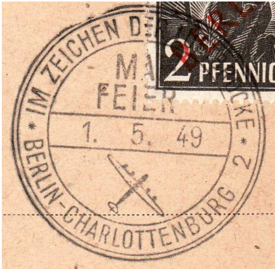
Stempel: Maifeier 1949

Arbeite aus den Informationen zu der exemplarischen Quelle heraus, wie ein Stempel als Quelle genutzt werden können.