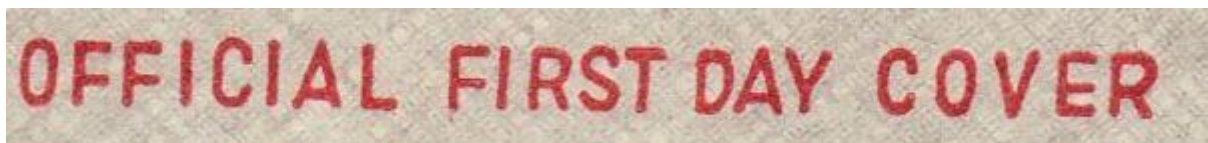
Ersttagsbrief (engl. First Day Cover)