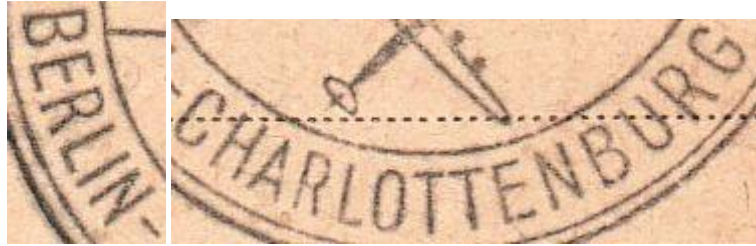
Berlin / Charlottenburg