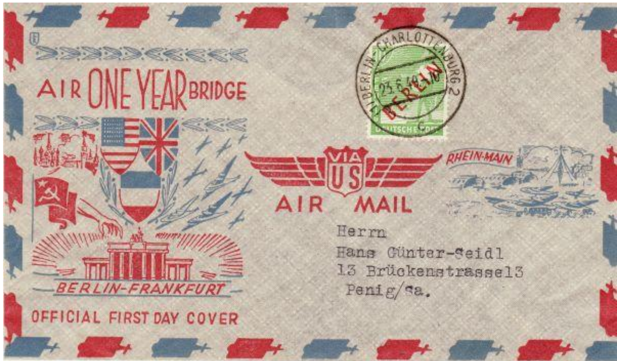
Ersttagsbeleg zur Luftbrücke vom 23.6.1949

Arbeite aus den Informationen zu der exemplarischen Quelle heraus, wie ein Beleg als Quelle genutzt werden können.