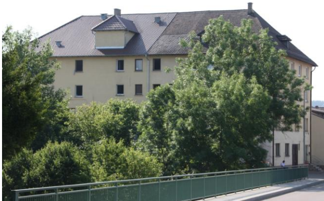
Übergangswohnheim in Laiz („Gelbes Haus“): Während ihres Asylverfahrens, das mehrere Jahre dauern kann, sind die Antragssteller in Gemeinschaftsunterkünften untergebracht. Sie dürfen den ihnen zugewiesenen Landkreis nicht verlassen und im Normalfall keiner Beschäftigung nachgehen. Immer wieder kommt es zwischen den Asylbewerbern, die aus ganz unterschiedlichen Kulturkreisen stammen, zu Rivalitäten, teilweise zum Ausbruch offener Gewalt. Ende 2017 soll die Unterkunft geschlossen werden.

ren wie „Direnc“. Kalok erklärt, die Figur stelle eine von Schmerzen gepeinigten Person dar, deren Haut abgezogen wurde – und stellt damit wohl auch den von den Kurden kollektiv erlebten Schmerz dar. Die Person muss Unmenschliches erlitten haben, und doch: die Hand ist zur Faust geballt. „Diese Faust lässt sich nicht beugen“, sagt Kalok.