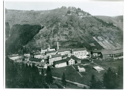
Die Firma Junghans um 1900

Zeichnet eure Vorschläge anschließend auf das große Arbeitsblatt ein.