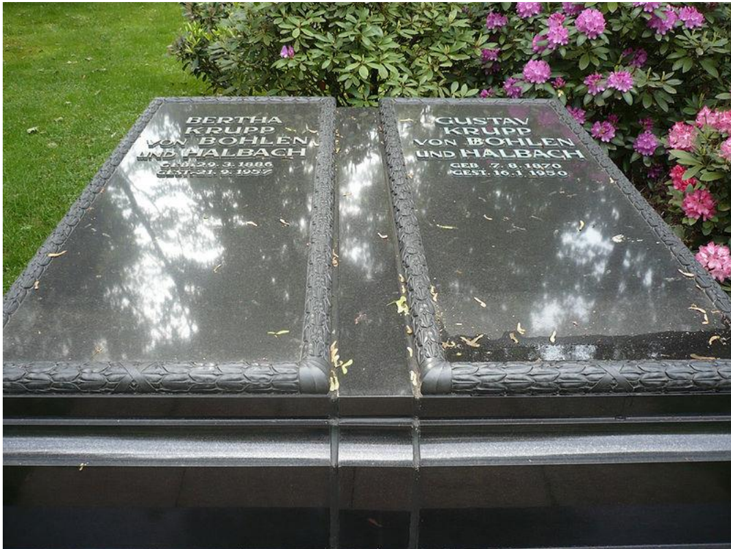
Grabstein von Gustav Krupp von Bohlen und Halbach und seiner Frau Bertha.