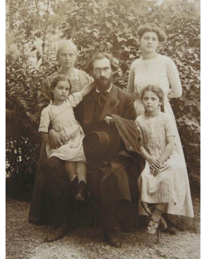
Familie Gustav Landauers im Sommer 1910. Bei dem Bild handelt es sich um eine Foto-Ansichtskarte an Constantin Brunner.