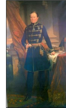
„König Wilhelm I. Württ“, gemeinfrei, Details auf Wikimedia Commons: https://commons.wikimedia.org/wiki/Template:PD-old [23.07.2019].

Ich möchte, dass meine Unternehmung erfolgreich ist. Deshalb ...