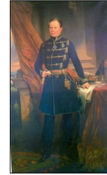
„König Wilhelm I. Württ“

Ich möchte, dass meine Unternehmung erfolgreich ist. Deshalb (sollen, müssen, dürfen, wollen) ...