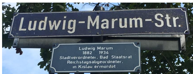
Abbildung: Ludwig-Marum-Straße in Karlsruhe