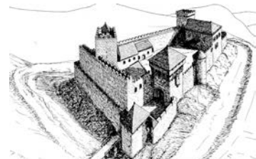
(© Verlag Moritz Schäfer)