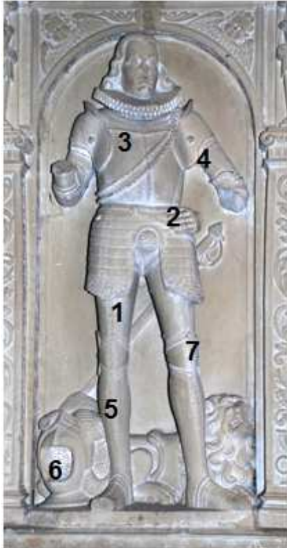
Hans von Handschuhsheim © Simone Heuser

Ritter mussten oft Kämpfe führen, für die sie eine teure Ausrüstung brauchten. Allein die eiserne Rüstung, die oftmals bis zu 50 Kilogramm wog und vor Hieben und Stichen schützte, hatte den Wert eines Bauernhofes. Sie bestand entweder aus unzähligen kleinen Metallringen, die zu Ketten zusammengefügt waren und Kettenhemd genannt wurde, oder aus zusammengesetzten Metallplatten, dem so genannten Plattenpanzer, der als Ganzkörperrüstung erst um das Jahr 1400 herum eingeführt wurde.