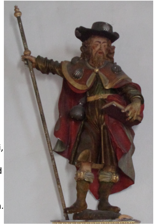
Statue von Jakobus in der Bergle-Kapelle, Gengenbach

Santiago de Compostela = spanisch für „Heiliger Jakobus vom Sternenfeld.“ Das Sternenfeld bezieht sich auf den Traum des Pelagius. Jakobus wurde so zum wichtigsten Heiligen für die Spanier, den sie im Kampf gegen ihre Feinde immer wieder um Hilfe baten. Es reisten auch immer mehr Menschen aus ganz Europa nach Santiago. Deswegen wurde Jakobus auch zum Patron (= Schutzheiliger) für alle Reisenden und Pilger (= Menschen, die einen heiligen Ort besuchen) und auch in anderen Ländern zu einem beliebten Heiligen.