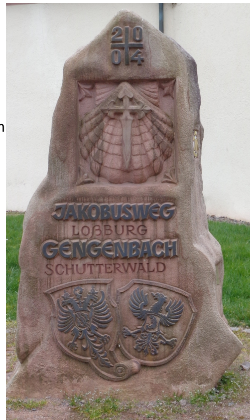
Pilgerstein neben der Jakobuskapelle, Gengenbach

Das stimmt nicht, das zeigt nur, dass die Leute damals sehr religiös waren.