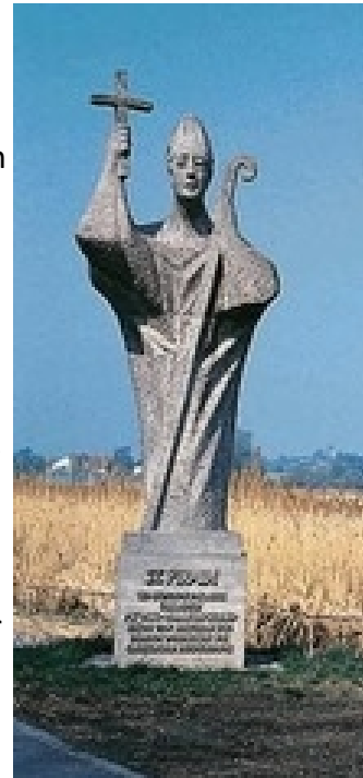
Statue des heiligen Pirmin auf der Insel Reichenau, Bodensee

repariert und fast komplett neu errichtet. In dieser Form kann man die Kapelle auch heute besichtigen. Die Jakobusstatue in der Kapelle stammt ebenfalls aus dieser Zeit.