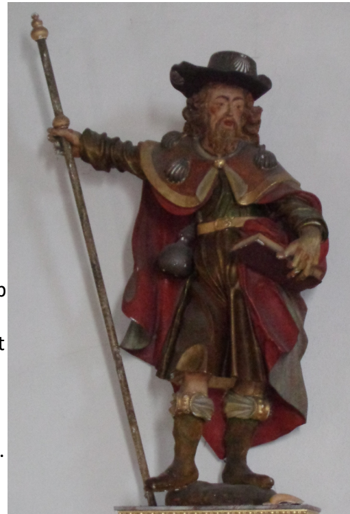
Statue von Jakobus in der Bergele-Kapelle, Gengenbach

Auf seinen Mantel und auf seinen Hut sind Muscheln genäht. Diese Muscheln, auch Jakobsmuscheln genannt, kommen in der Gegend von Santiago vor, wo das Grab des Jakobus liegt. Ursprünglich wurden sie von Pilgern aus Santiago mitgebracht, als Beweis, dass sie dort waren. Sie wurden aber auch zum Erkennungszeichen für Pilger auf dem Jakobsweg, dem Weg nach Santiago.