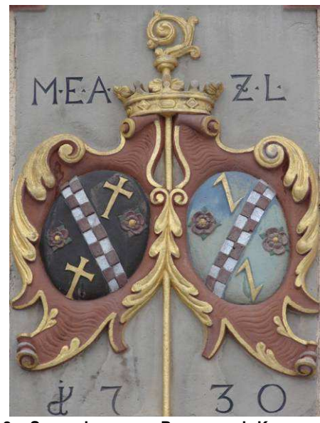
8 Sammelwappen: Rosen und Kreuze = Wappen der Äbtissin, Flößerhaken und rot-weiß kariertes Querstreifen: siehe oben (anderes Sammelwappen); „MEAZL“ steht für „M(aria) E(uphrosina) A(ebtissin) z(u) L(ichtenthal)“; im Jahre „1730“ wurde das Gebäude errichtet.