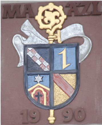
1 Sammelwappen mit Äbtissinnenstab und vier Feldern (von links oben im Uhrzeigersinn: Wappen Bernhards von Clairvaux, des Klosters Lichtenthals, Badens, der Äbtissin); „MAAZL“ steht für „M(aria) A(delgundis) A(ebtissin) z(u) L(ichtenthal)“; 1990 wurde der Umbau der ehemaligen Wirtschaftsgebäude zu Gästehäusern abgeschlossen.

Suche die neun Bildmotive! Für ein Motiv musst du das Klostergelände sogar verlassen. Markiere den jeweiligen Fundort exakt im Klostergrundriss auf der Rückseite, indem du dort die richtige Zahl einträgst.