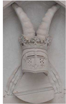
3 Wappen der Markgrafen von Baden: Schild mit (rotem) Querbalken auf (goldenen) Grund und Helmzier: gekrönter Helm mit Steinbockhörnern