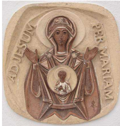
2 Darstellung von Maria (groß) und Jesus; Inschrift „Ad Jesum per Mariam“ = „Mit Hilfe von Maria zu Jesus“; Maria wird in der Abtei Lichtenthal besonders verehrt; der Überlieferung nach hat sie das Kloster mehrfach gerettet.