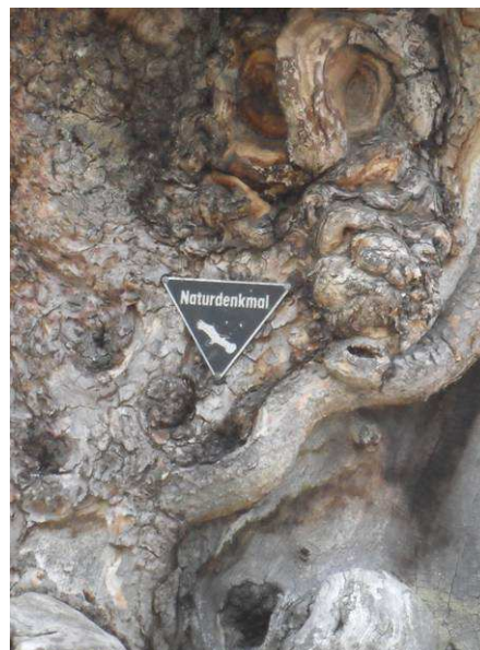
7 ??? (... musst du selbst herausfinden!)