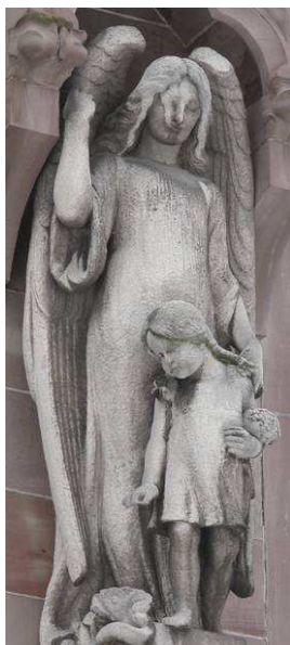
6 Schutzengel mit kleinem Mädchen