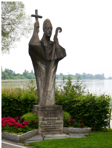
M1 – Statue vom Heiligen Pirmin auf der Reichenau.