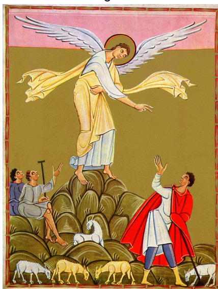
M3 – Reichenauer Buchmalerei um 1000.

M1 & M2 © Carsten Arbeiter M3 © Sidonius bei Wikipedia Commons. M4 © Von Broederhugo at Niederländisch Wikipedia, CC BY-SA 3.0, https://commons.wikimedia.org/w/index.php?curid=1835488 M5 © Wikipedia gemeinfrei