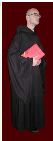
M4 – Benediktinermönch mit Ordenstracht