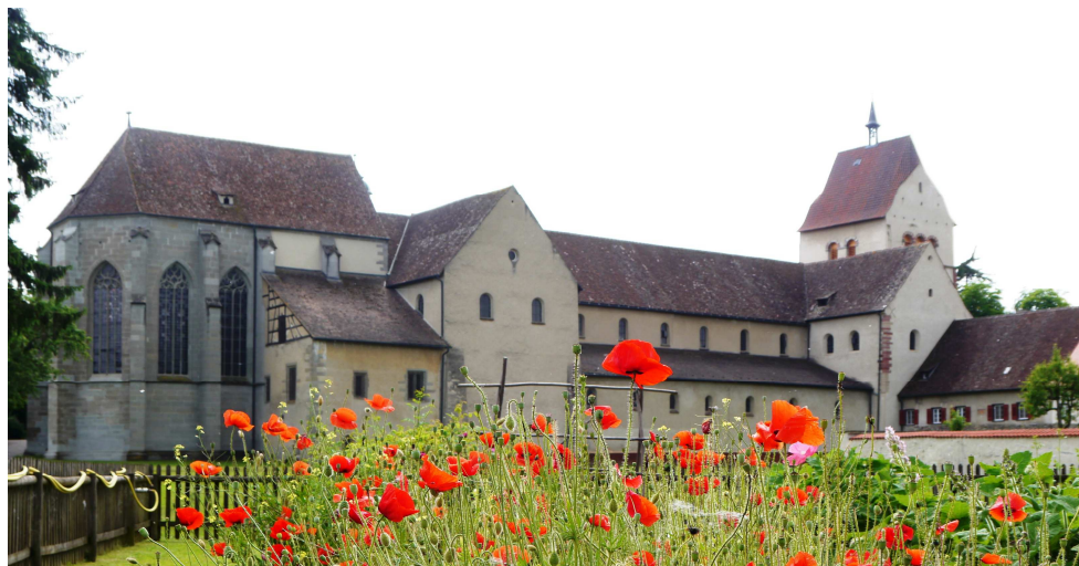
M2 - Das Münster in Mittelzell

M1 & M2 © Carsten Arbeiter M3 © Sidonius bei Wikipedia Commons. M4 © Von Broederhugo at Niederländisch Wikipedia, CC BY-SA 3.0, https://commons.wikimedia.org/w/index.php?curid=1835488 M5 © Wikipedia gemeinfrei