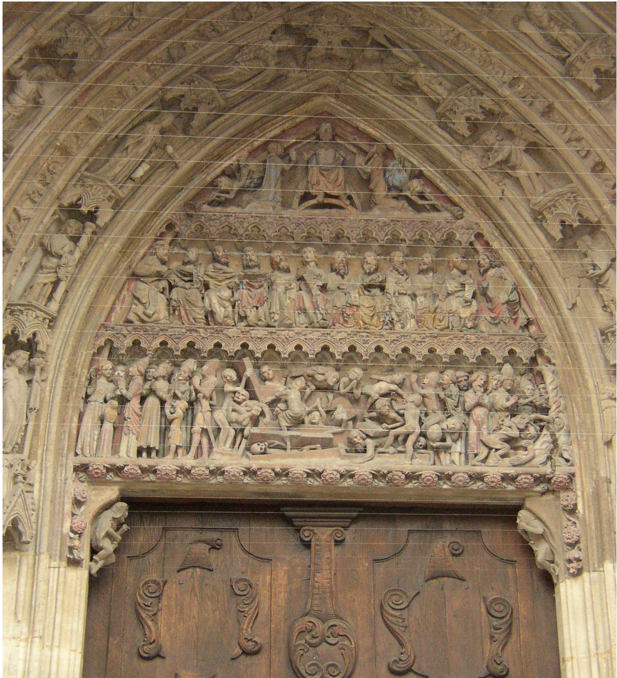
B 13: Portal über der Eingangstür am Heilig-Kreuz-Münster