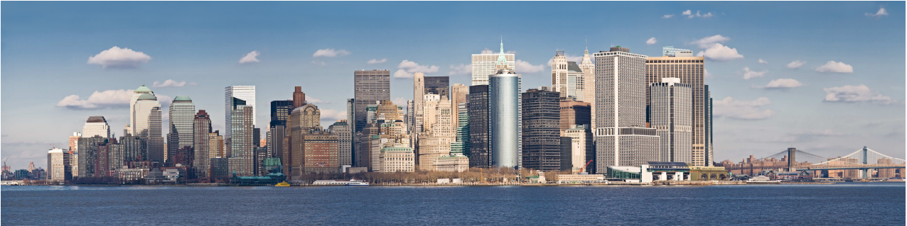
Skyline von New York von der der Staten-Island-Fähre aus. Fotos aus dem Jahr 2006