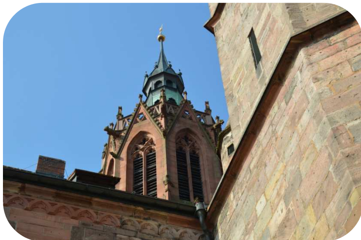
B6 Gotischer Kirchturm