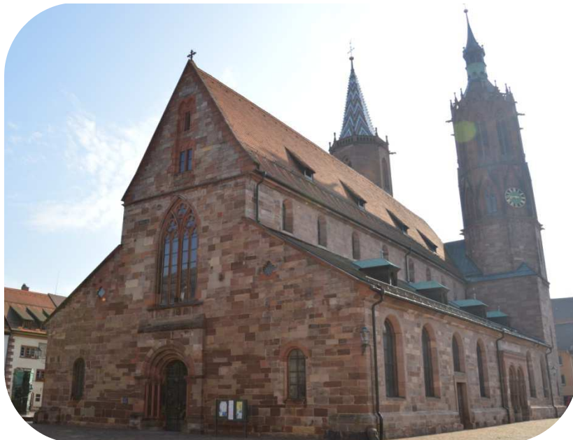
B3 Münster „Unserer lieben Frau“

Archäologen glauben, dass der Bau des Münsters 1120 begann. Ein Münster war für die damalige Zeit ein sehr großes Bauvorhaben, an dem häufig viele Generationen beteiligt waren. Meistens zog sich der Bau einer solchen Kirche sogar über Jahrhunderte hinweg. Deshalb sind an einer Kirche verschiedene Baustile zu entdecken, so auch in Villingen. Der Südeingang des Münsters wird dem Baustil Romanik (frühes 12. Jahrhundert) zugeordnet, während die Doppeltürme zur Gotik gehören. Hoch aufragende Kirchtürme waren für die mittelalterliche Stadt ein religiöses Symbol, ein Symbol der Macht und des Reichtums und gleichzeitig boten Kirchtürme eine gute Möglichkeit, das Land zu überblicken.