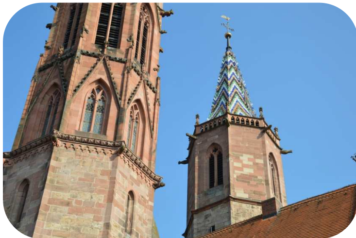
B5 Gotische Kirchtürme