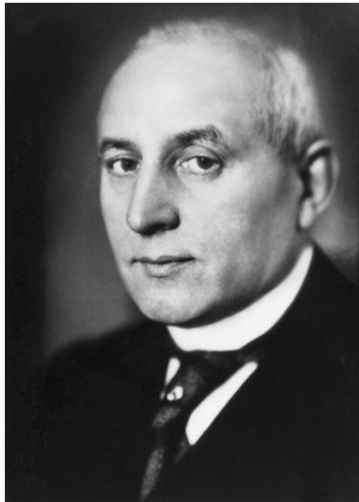
Eugen Bolz 1930