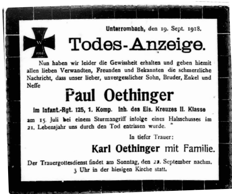
Kocherzeitung v. 19.09.1918