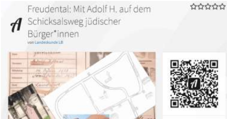
© Hans-Jörg Gerste, Bilder PKC Freudental (B14)

Ergebnisse/Erkenntnisse/ Perspektiven ... Antijüdische Politik vor Ort - Adolf H., ein typisches Schicksal? - Wie erinnern?