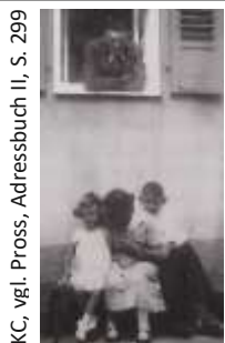
vgl. Pross, Adressbuch II, S. 299