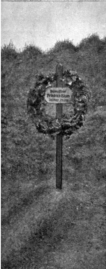
Abb.1 Feldgrab bei Péronne im April 1918