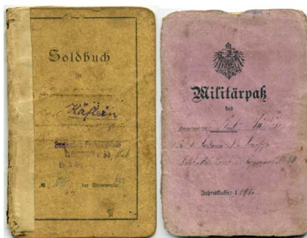
Abb.8 Das Soldbuch (Militärausweis) und der Militärpaß von Karl Käflein sind noch komplett erhalten. Dank dieser beiden Dokumente und der rund 52 ebenfalls noch vorhandenen Feldpostkarten und Feldpostbriefe kann sein Zeit als Soldat im Ersten Weltkrieg lückenlos nachvollzogen werden.