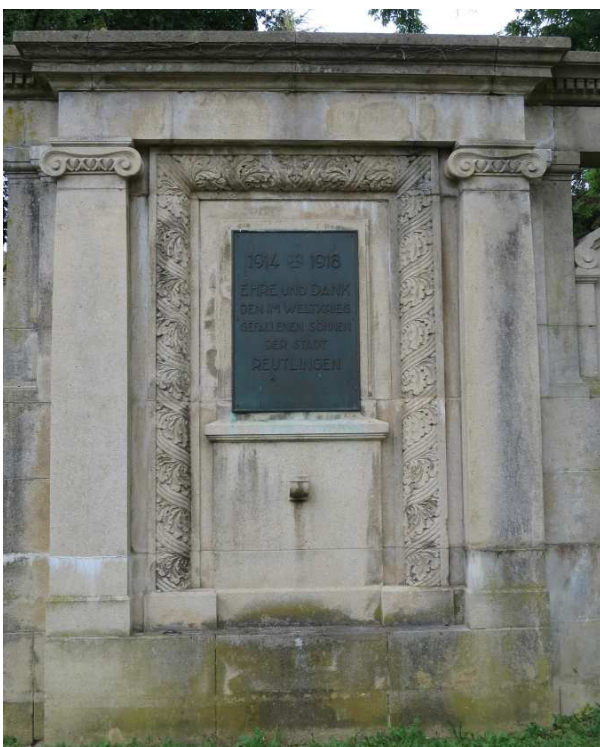
Kriegerdenkmal Unter den Linden (Detail)