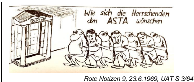
Rote Notizen 9, 23.6.1969, UAT S 3/64

Die in der Neuen Aula etablierte Bürokratie ist das Instrument, mit dem bisher und in Zukunft verstärkt die Pläne der Herrschenden [...] durchgesetzt werden. Sie wird dafür sorgen, dass der mit dem Hochschulgesamtplan, dem Ordnungsrecht, der Grundordnung und der Zerschlagung der AStA vorbereitete Schlag zur beabsichtigten Liquidierung der studentischen Opposition führt. Wenn wir langfristigen und wirksamen Widerstand gegen die beabsichtigten Disziplinierungsmaßnahmen planen, müssen wir den Technokraten dieses Instrument aus der Hand schlagen!