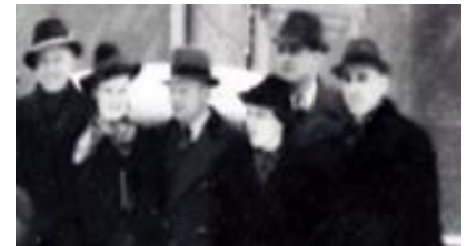
Rauschenbergers Kolleginnen und Kollegen in Heidenheim bei ihren Ermittlungen 1939 im Fall Georg Elser.