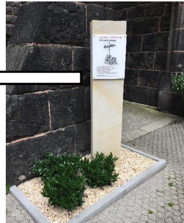
Abbildung 2: Gedenkstele

Dieser QR-Code führt euch zur interaktiven Lernorterkundung auf ThingLink.com: