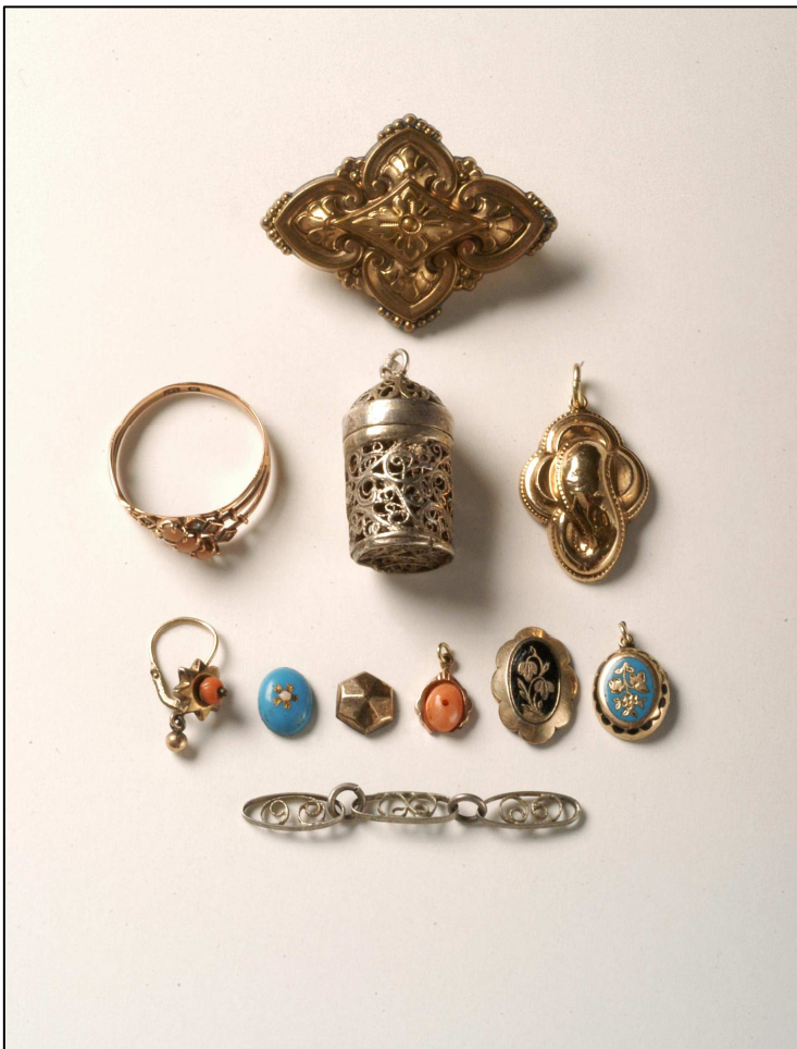
Bild links: In den 60er-Jahren erstand eine junge Frau über mehrere Jahre hinweg in einem Haigerlocher Uhren- und Schmuckgeschäft immer wieder einzelne Schmuckstücke. Die Geschäftsinhaberin sagte der jungen Frau, es handle sich um Schmuck, der von den Juden aus Haigerloch stamme. Die Käuferin nimmt an, dass die Haigerlocher Juden den Schmuck vor ihrer Emigration oder ihrer Deportation an den Inhaber des Uhren- und Schmuckgeschäftes verkauften. Ob dies stimmt oder einzelne Teile sogar bei der Leibesvisitation entwendet wurden, lässt sich nicht mehr rekonstruieren.