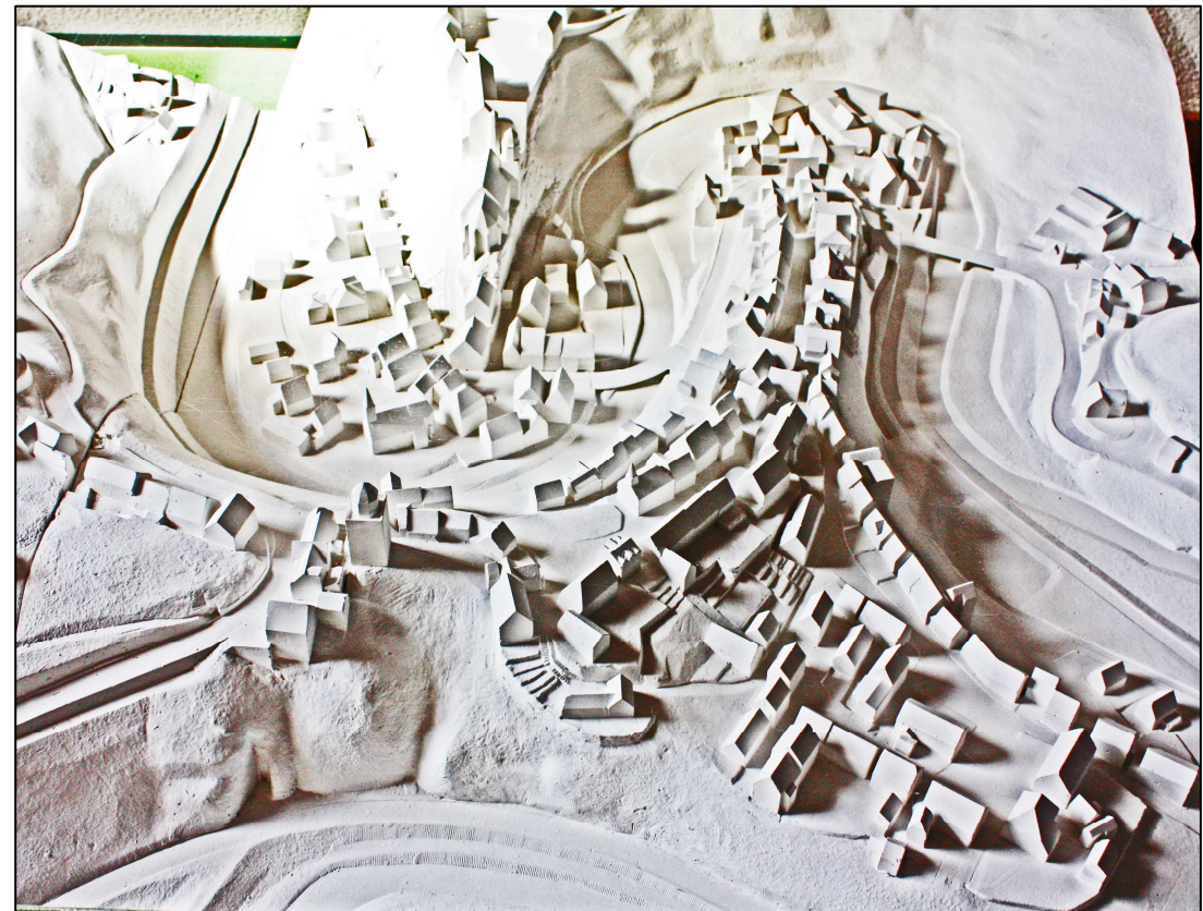
PES-Modell: Gerhold Bucher, Horb a.N., Photo: Markus Fiederer, 2009