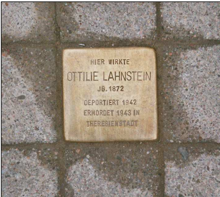
„Stolperstein“ vor der Nikolauspflge in Stuttgart