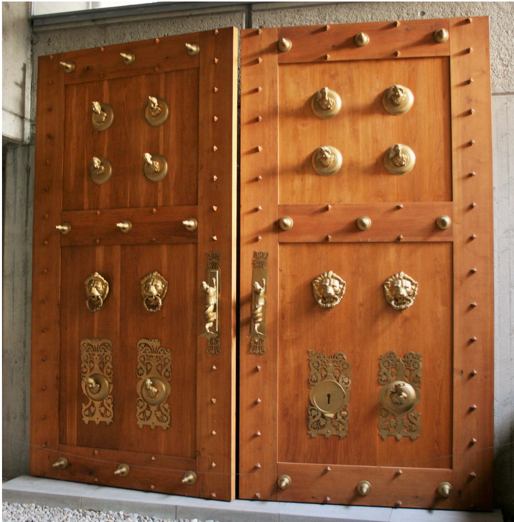
B 11