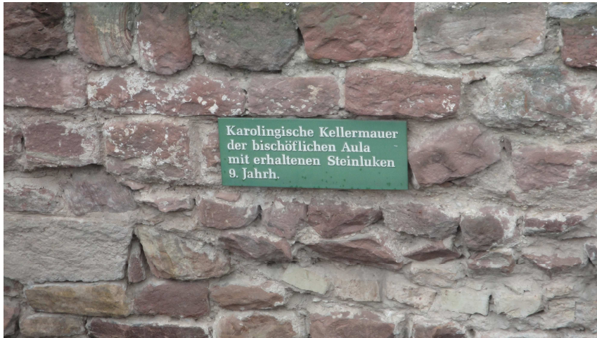
B 13