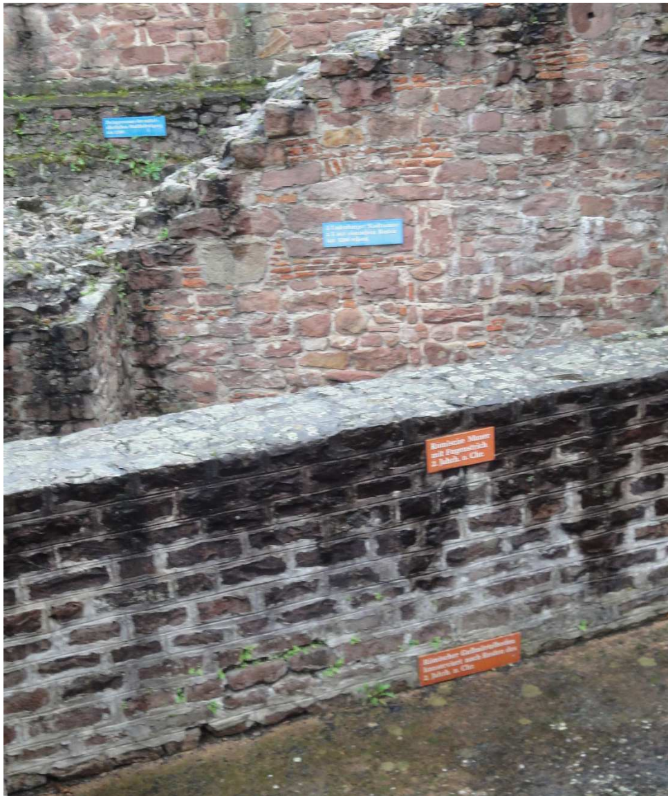
B 14