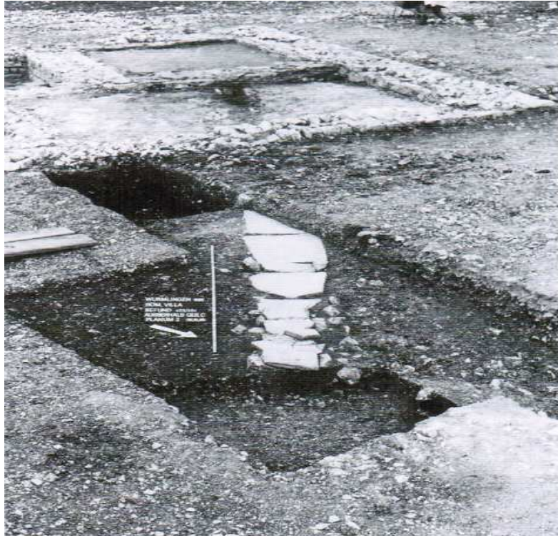
B3: Reste eines Abwasserkanals