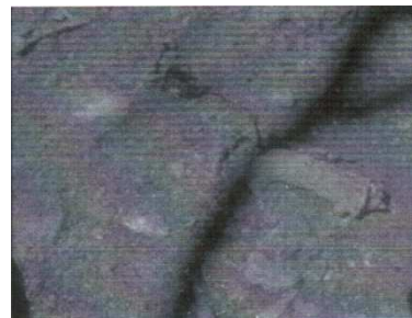
B11: Adlerkopfaufsatz in Fundlage