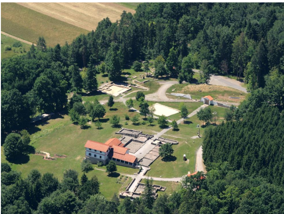
B 1 Luftbild – Gesamtanlage des Freilichtmuseums