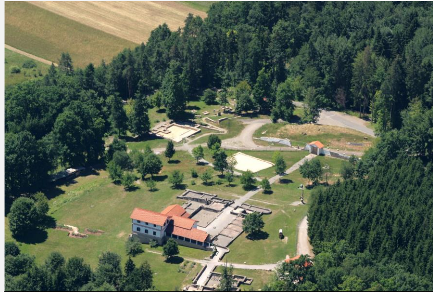
B 1 Luftbild – Gesamtanlage des Freilichtmuseums